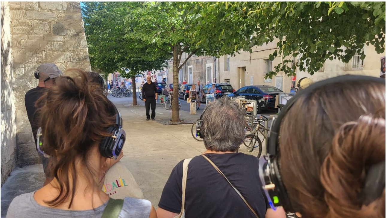
Maquette avec le Théâtre Transversal, Avignon, 16/07/26

C'est un coup de cœur pour cette langue et ce personnage complexe qui me pousse aujourd'hui à adapter ce texte au théâtre.