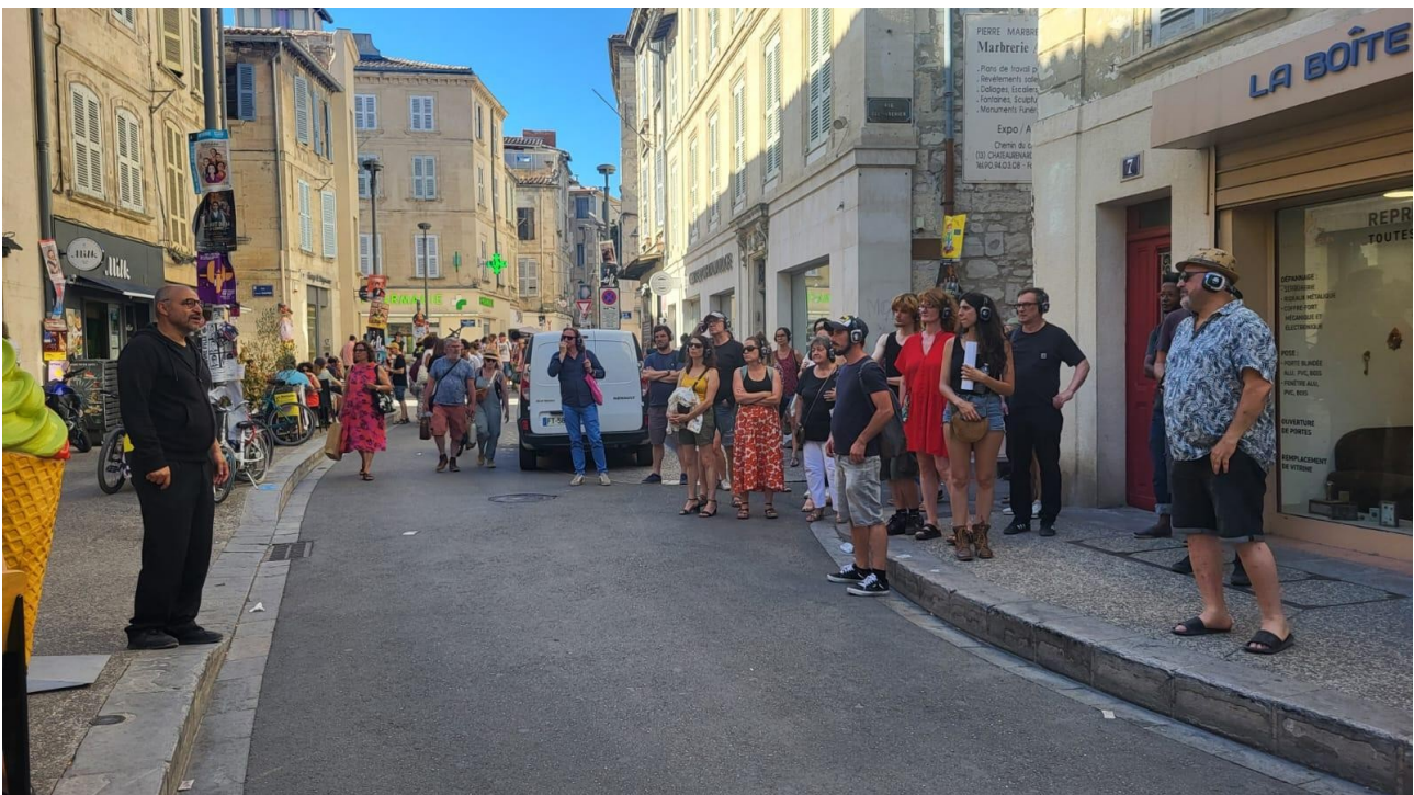
Maquette avec le Théâtre Transversal, Avignon, 16/07/26

Réfugié dans sa nouvelle errance, il ponctue ses semaines par des échanges fugaces, mais quotidiens, avec des femmes ou des jeunes filles, toujours les mêmes, dont le prénom rime avec celui de son Alma disparue. À son insu, comme si ces figures le révélaient à lui-même, des images refoulées de vergers en fleurs, des odeurs d’iode, d’anis ou de jasmin le submergent... Renonçant à lutter contre l’insoutenable déferlante du passé, que ni les rituels, ni la drogue, ni l’alcool n’ont pu contenir, il baisse la garde... Ses nuits tourmentées, sur lesquelles veille la fidèle Minuit, une chienne rencontrée sur une tombe, il va les consacrer au récit du cauchemar éveillé dans lequel il se débat depuis si longtemps, et qu’il avait pourtant essayé de fuir en venant s’installer de l’autre côté de la Méditerranée.