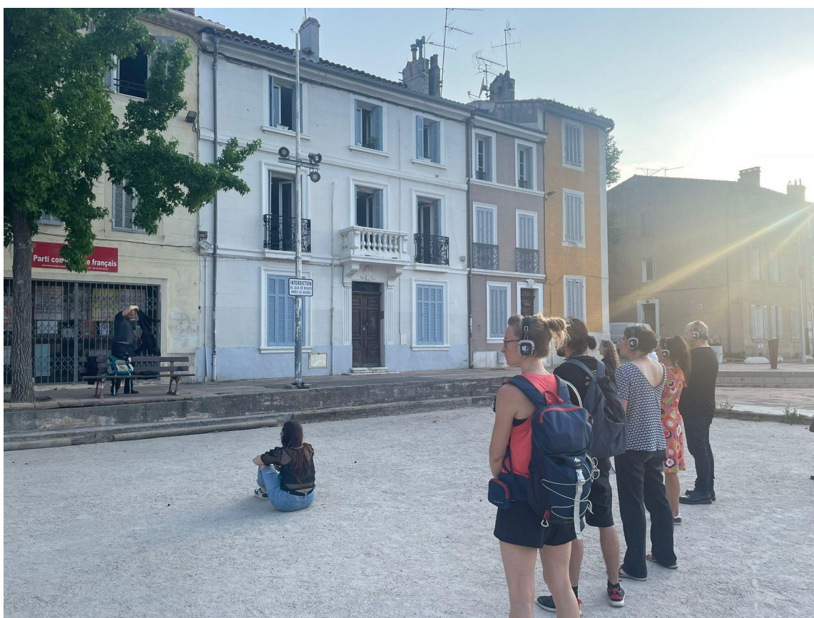
Sortie de résidence à La Distillerie, Aubagne 07/06/2025

On le suivra à travers les rues où des éléments pris dans le réel de la ville (supérette, impasse, immeuble d'habitation...), créeront l'espace scénographique des différentes scènes. Ainsi, nous inscrivons l'histoire et le personnage dans le quotidien des spectateurs et spectatrices. Nous offrons une nouvelle histoire aux lieux qu'ils et elles traversent parfois quotidiennement, et mettons la lumière sur les « invisibles » qui vivent sur nos trottoirs.