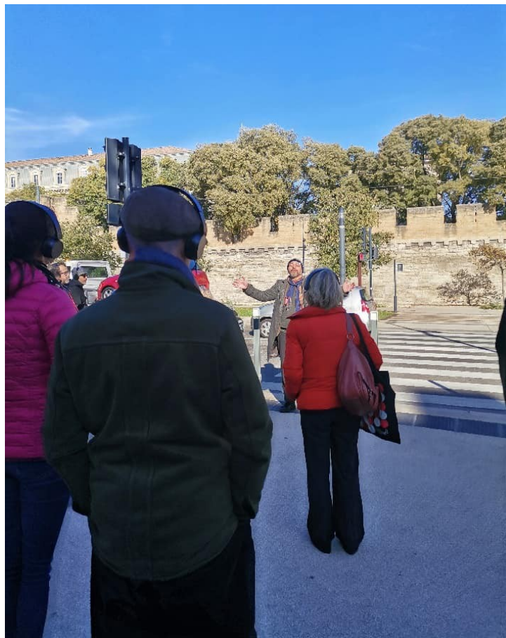
Présentation maquette « Bleu Nuit », résidences Tremplin Avignon le 14/11/2024