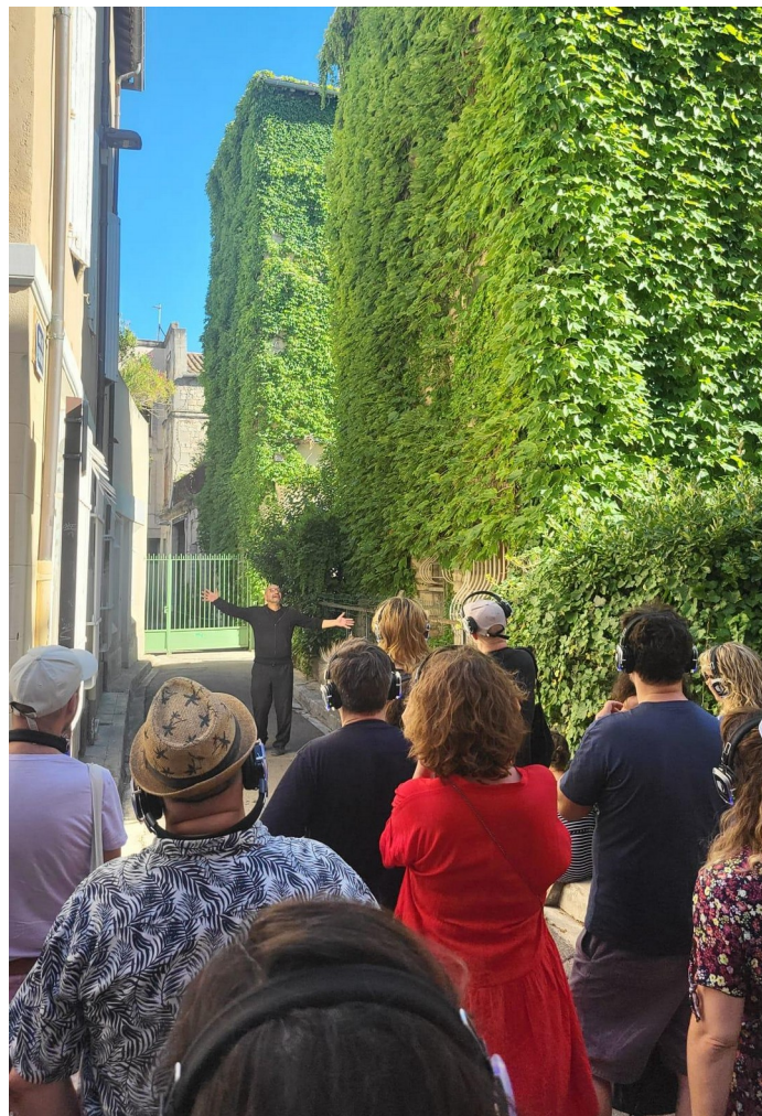
Maquette avec le Théâtre Transversal, Avignon, 16/07/26

Deux boucles magnétiques seront disponibles pour les personnes malentendantes, il sera possible d'en obtenir davantage sur réservation au préalable.